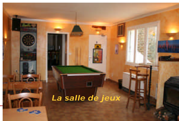
La salle de jeux