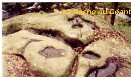
La Roche au Géant